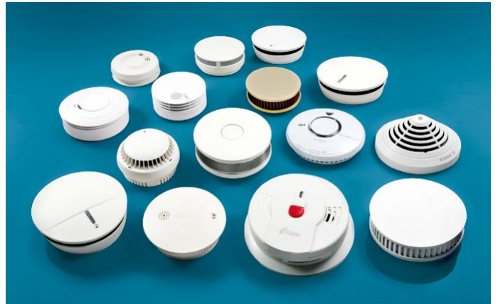
Abb.: Auswahl Rauchwarnmelder verschiedener Hersteller

Die Notstrom-Option gewährleistet eine einwandfreie Funktionsbereitschaft auch bei Stromausfall. Qualitativ hochwertige Melder arbeiten weitestgehend wartungsfrei.